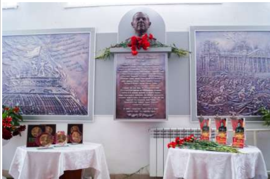
Памятная доска Ф.М. Зинченко