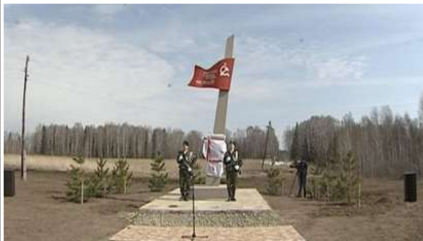
Памятник на месте деревни Ставская