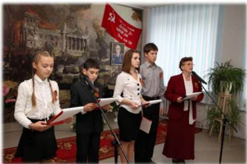
Выступление активистов школьного краеведческого музея имени Ф.М. Зинченко, МБОУ «Кривошеинская СОШ имени Героя Советского Союза Ф.М. Зинченко»