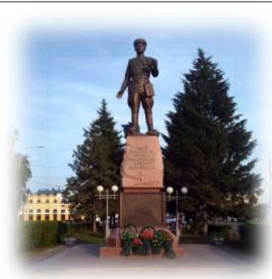
Памятник Ф.М. Зинченко возле вокзала Томск-1