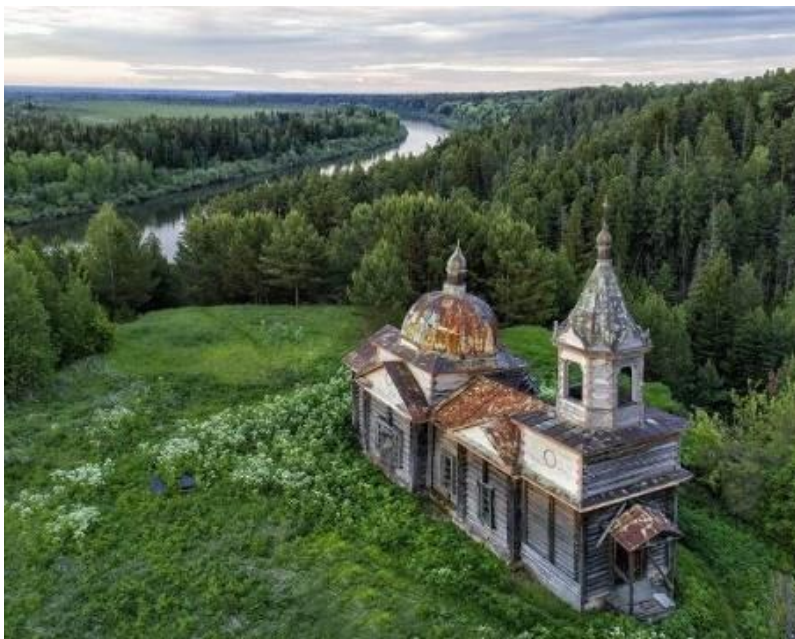
Петропавловская церковь в Нагорном Иштане