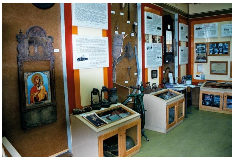
Музей МБОУ «Зоркальцевская СОШ» Томского района