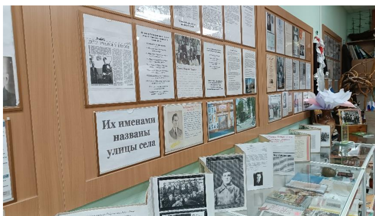
Музей «Отечество» МАОУ «Моряковская СОШ» Томского района