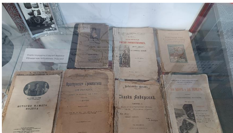
Экспонаты Музея истории народного образования МБОУ «Рыбаловская СОШ» Томского района