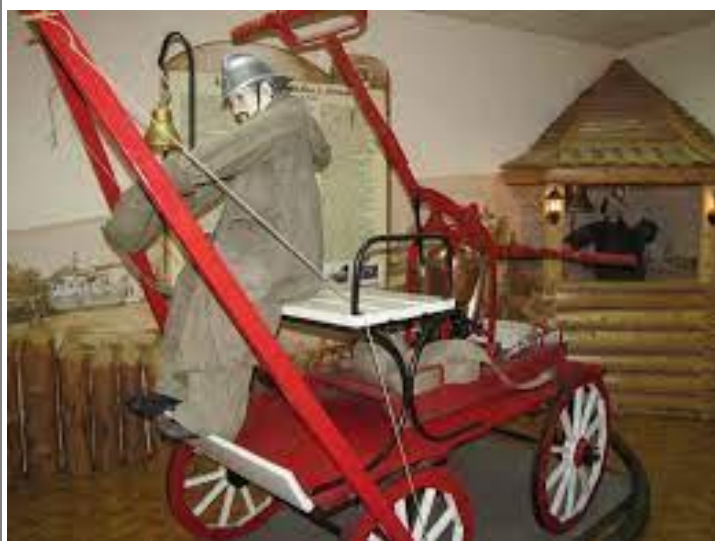
Музей истории пожарной охраны Томской области