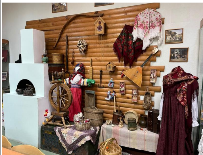
Музей истории школы в МАОУ СОШ № 12 г. Томска