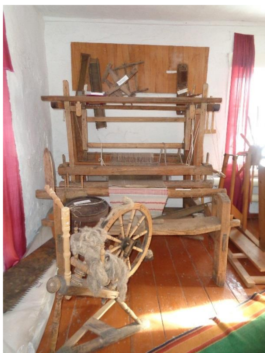
Музей имени Г.М. Рейле МБОУ «Березовская СОШ» Первомайского района