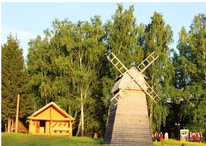
Янов хутор в д. Березовка Первомайского района общественном транспорте.