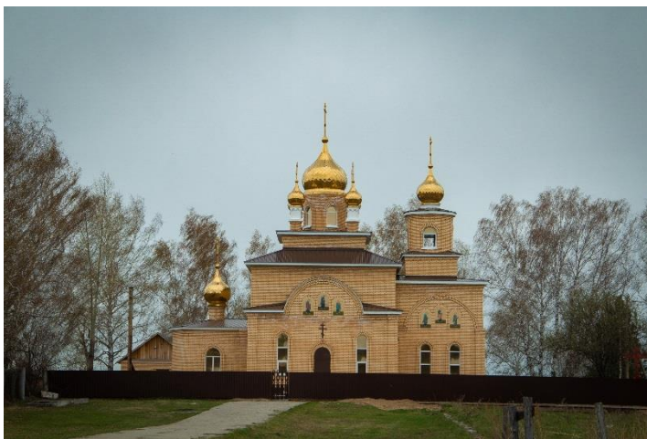
Храм Святой Великомученицы Екатерины в с. Крутоложное Первомайского района