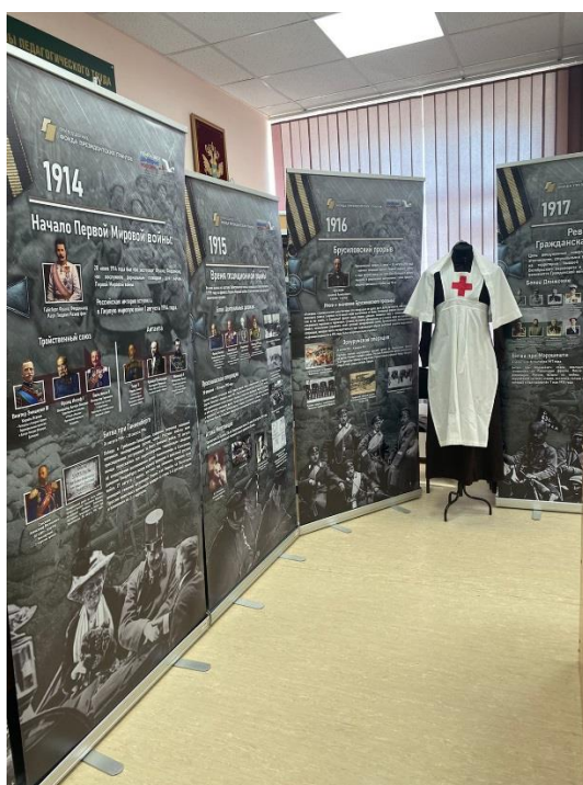
Музей истории системы образования Первомайского района МБОУ «Первомайская СОШ» Первомайского района