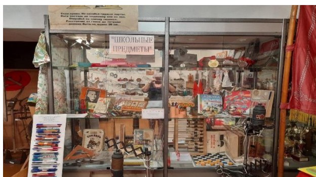
Экспозиция «Школьные предметы»