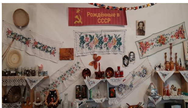
Экспозиция «Рождённые в СССР»