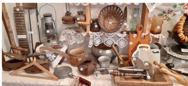
Экспозиция «Домашняя утварь»