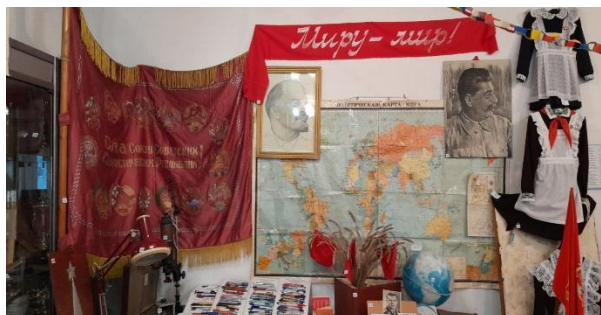
Экспозиция «Миру – мир»