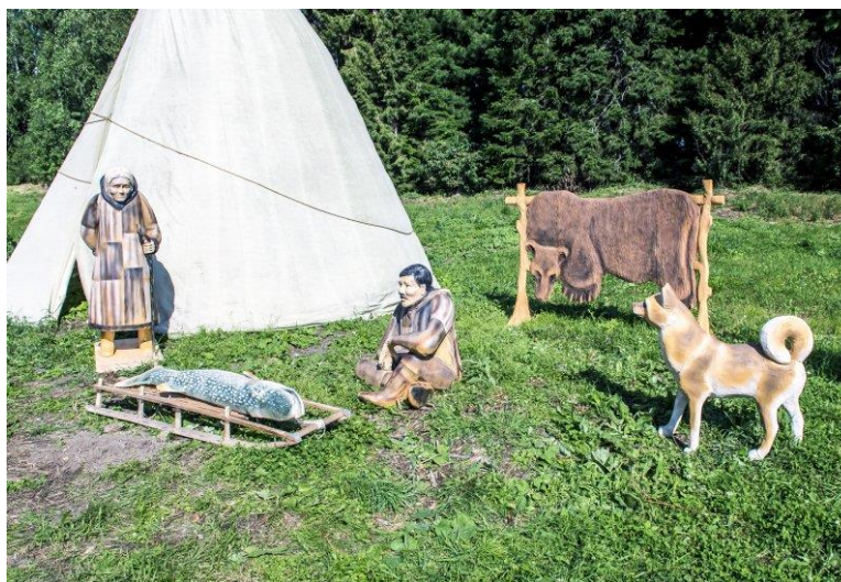
Музей селькупской культуры «Чумэл Чвэч»