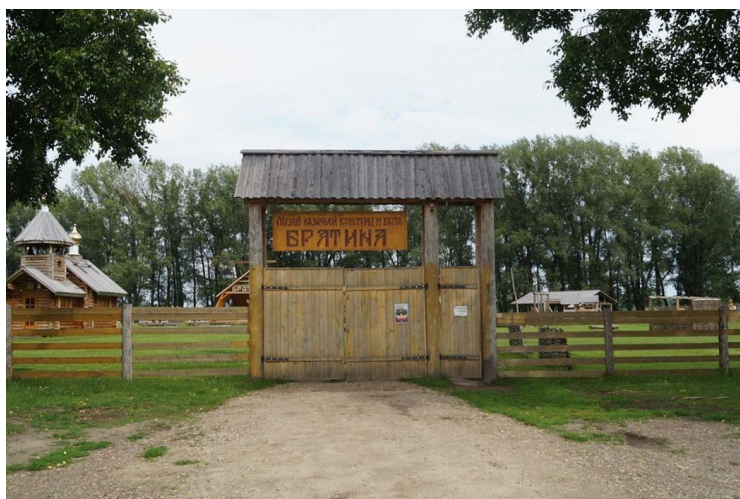
Музей казачьей культуры «Братина»