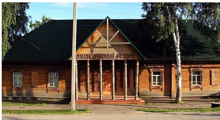
Парабельский краеведческий музей