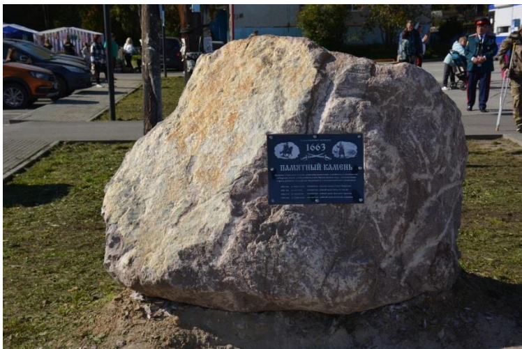
Корнилово, памятный камень казакам-основателям