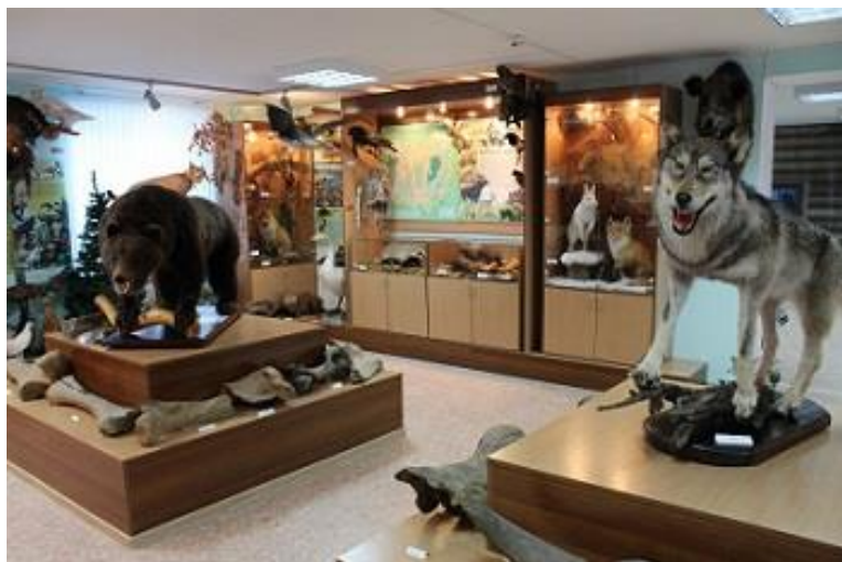
Шегарский краеведческий музей