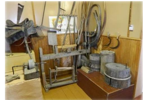
Зал «Комната ремесел»

Погулять по таким местам — одно удовольствие