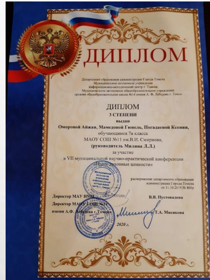
«Наши духовные ценности»