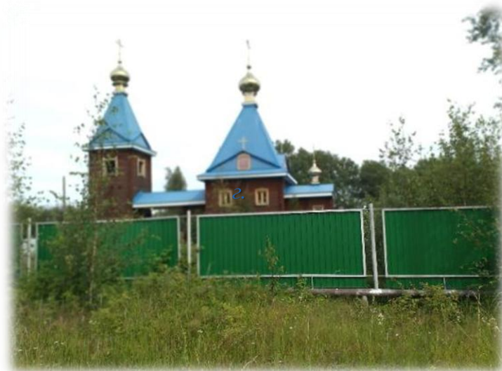
Приход. Александровский р-он, август 2022г.