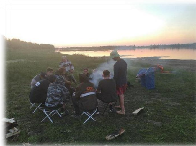
Ночевка на берегу реки Обь. Июль 2022.