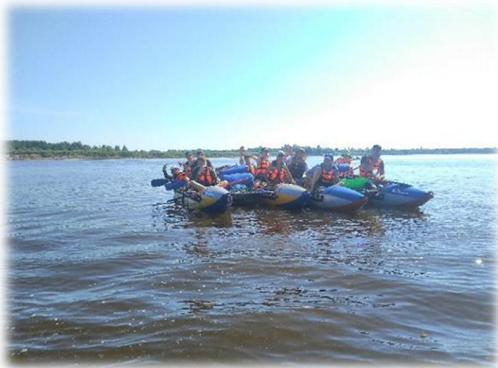
Сплав по Оби с. Александровское- ур. Кичаново- ур. Волково – ост. Колтагорск – г. Стрежевой . Июль 2022.