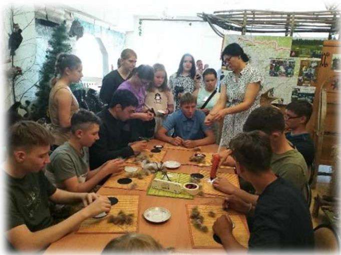
Мастер класс по изготовлению оберега с. Александровское . Июль 2022.