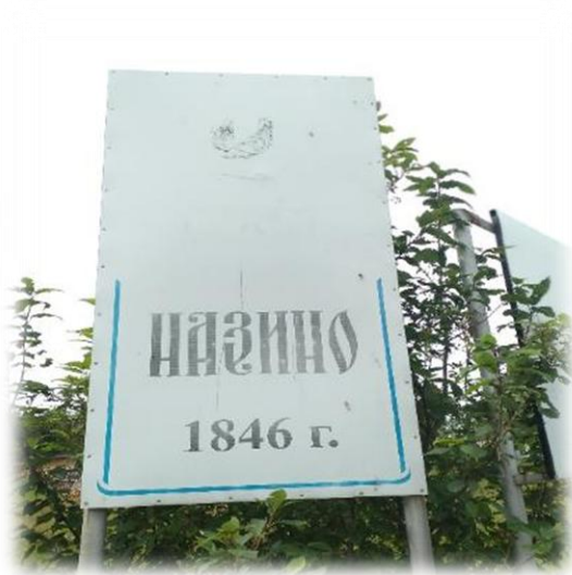
Село Назино. Александровский р-он, август 2022г.