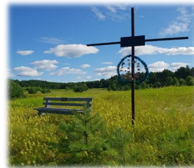
Урочище Волково. Памятный крест спецпереселенцам. Каргасокский р-он, июль 2022г.