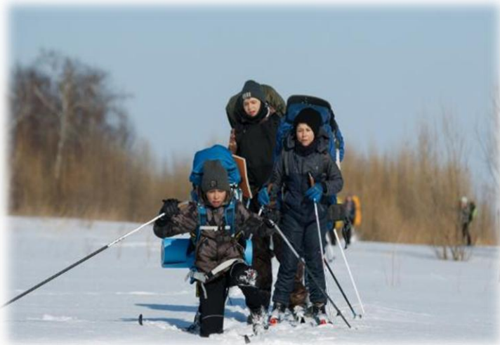
Преодоление локальных препятствий. Александровский р-он, март 2021г.