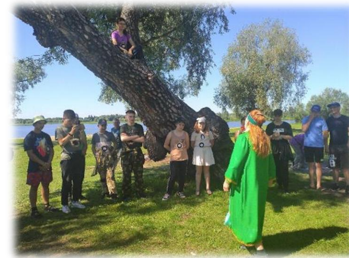
Сказка о том как образовалась земля Сибирская с. Александровское . Июль 2022.