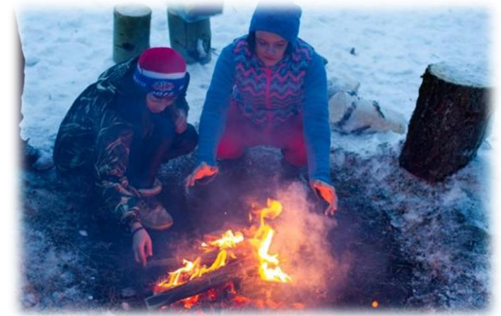
Обустройство бивуака. Александровский р-он, март 2021г..