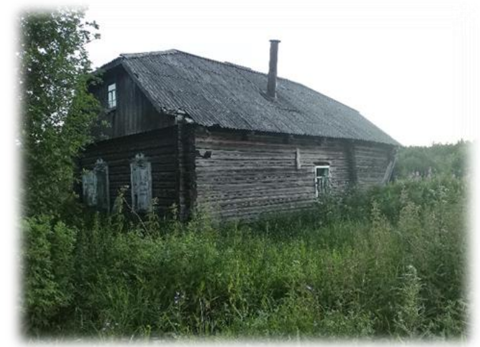
Урочище Кичаново Александровский район. Июль 2022.