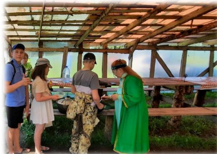
Национальная кухня. Уха из карася. с. Александровское . Июль 2022.