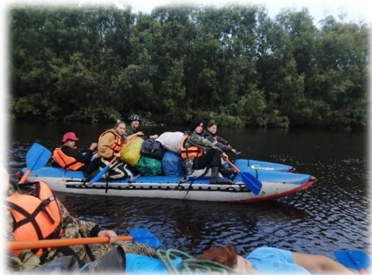
Слав по р. Васюган. Каргасокский р-он, июль 2022г.