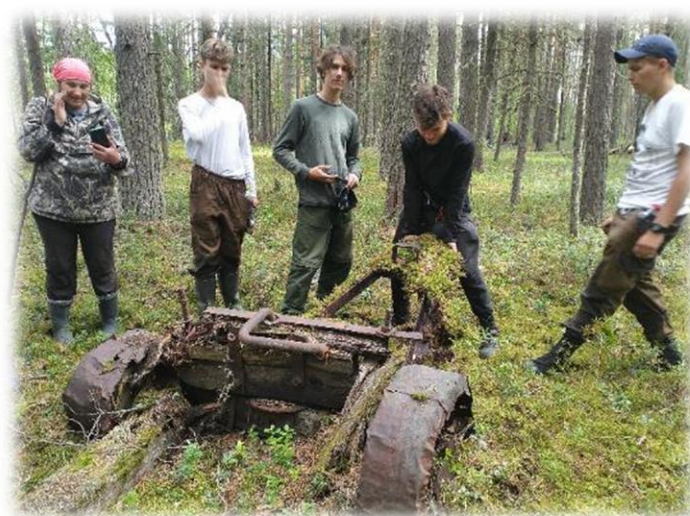
Находка в урочище Айполово. Каргасокский р-он, июль 2022г.