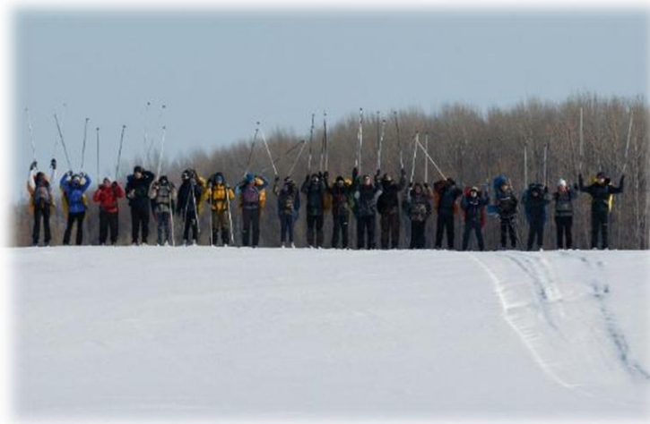
Лыжный многодневный поход г. Стрежевой- с. Александровское . Александровский р-он, март 2021г.